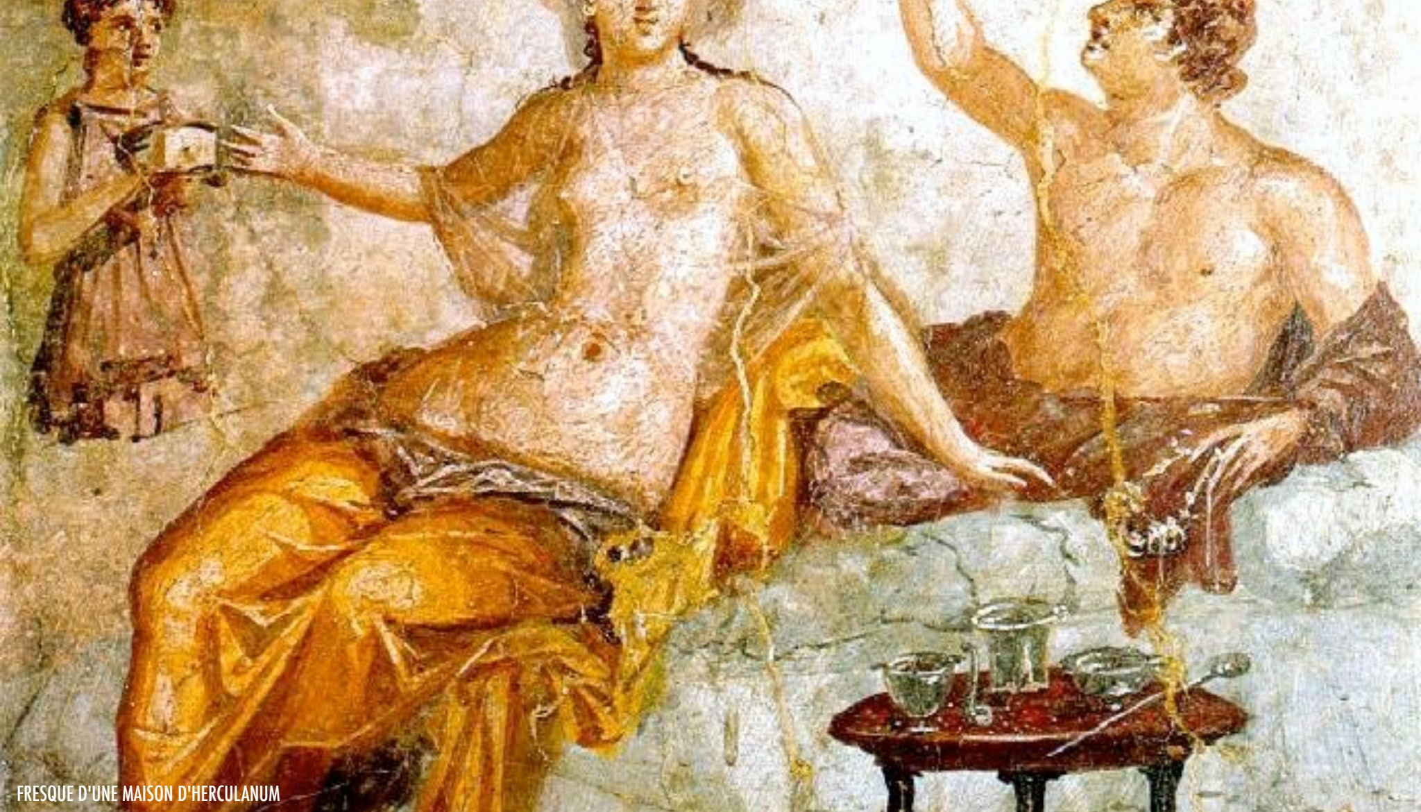
FRESQUE D'UNE MAISON D'HERCULANUM