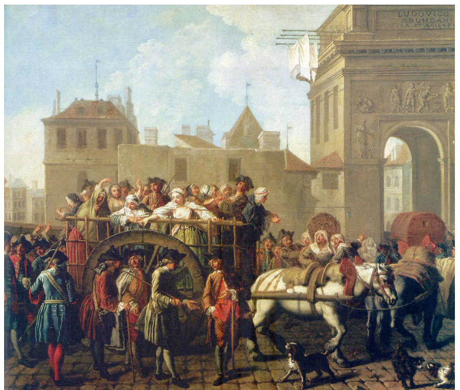
En route pour la Salpêtrière

Durant La Réforme et la Contre-Réforme on observe un retour à la morale, aussi bien chez les partisans de la nouvelle religion que chez ceux de l'Eglise. Les mœurs doivent s'assagir à cause de l'apparition de la syphilis. En France, une Ordonnance de 1560 supprime les bourdeaux.