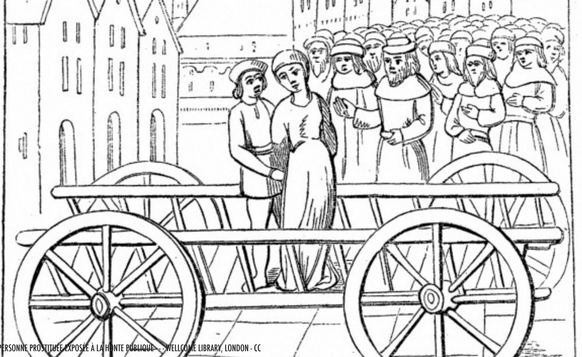
UNE PERSONNE PROSTITUÉE EXPOSÉE À LA HONTE PUBLIQUE