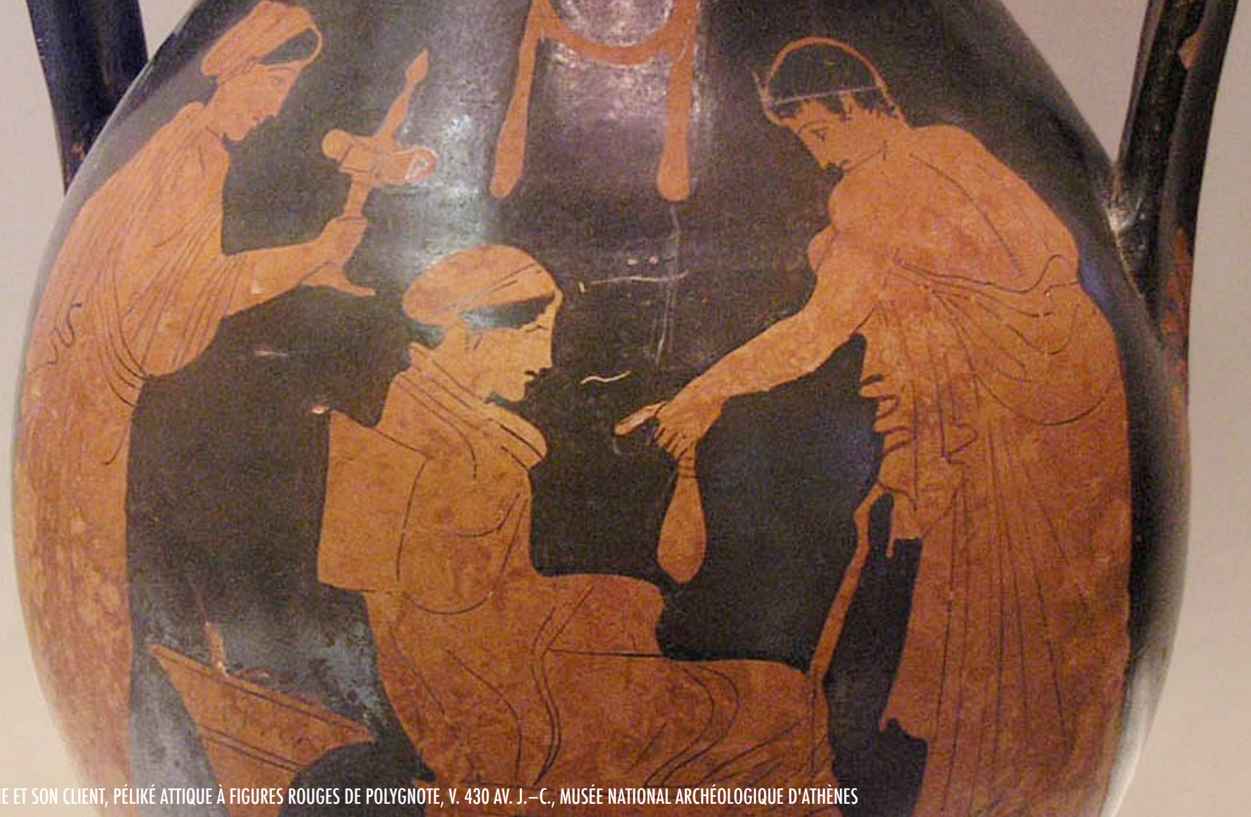
COURTISANE ET SON CLIENT, PÉLIKÉ ATTIQUE À FIGURES ROUGES DE POLYGNOTE, V. 430 AV. J.-C., MUSÉE NATIONAL ARCHÉOLOGIQUE D'ATHÈNES